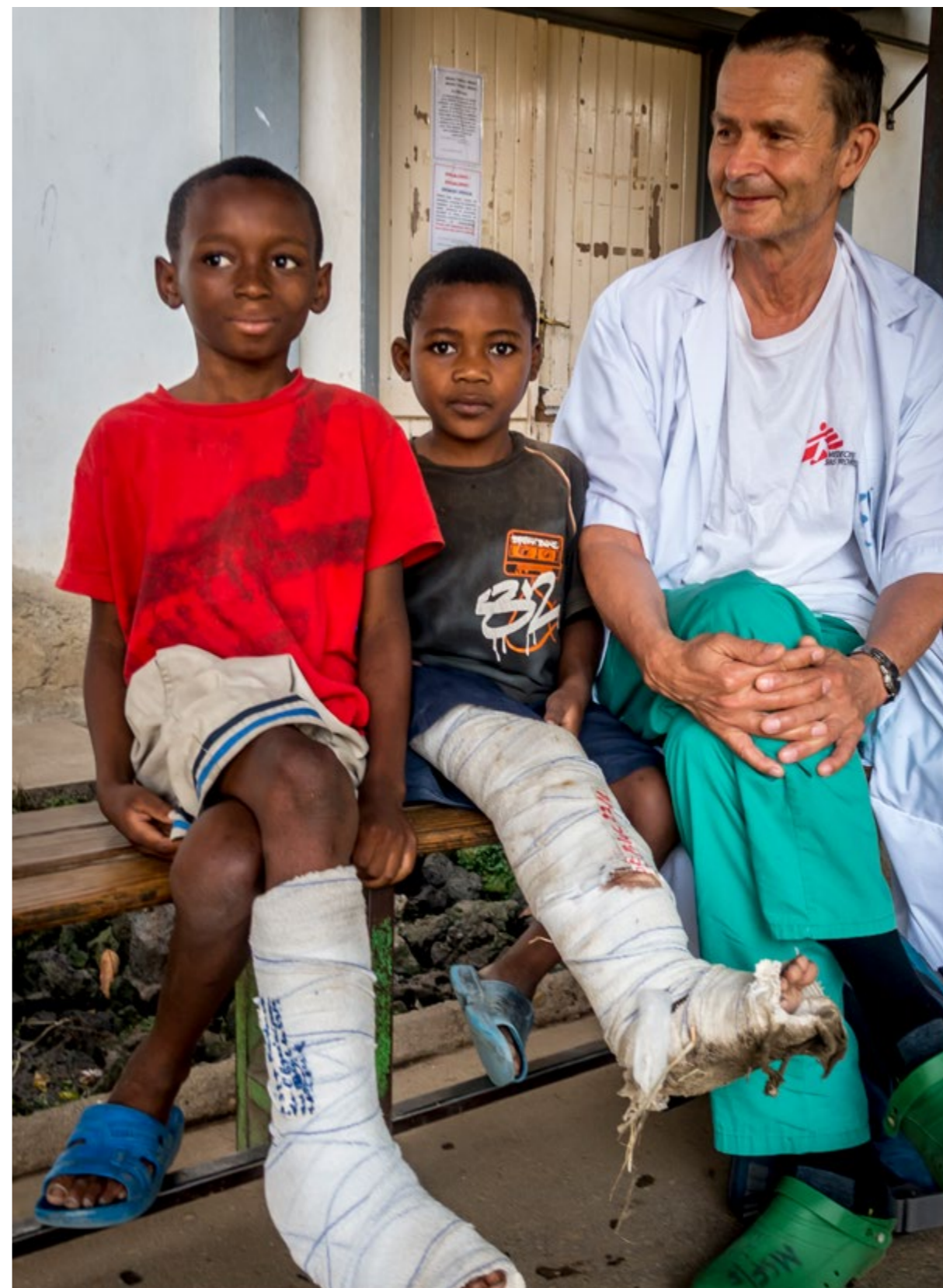
Kongon demokraattinen tasavalta

Luumätää sairastavat potilaat joutuivat olemaan sairaalassa pitkiä aikoja. Kuva Matti Rauvalan kotialbumista.